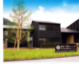
6 長良川うかいミュージアム