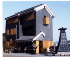
2 鵜飼観覧船事務所(のりば)