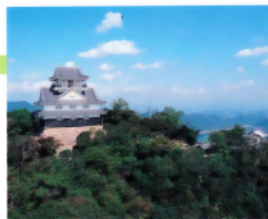
1 国史跡 岐阜城跡