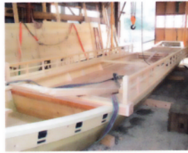
4 鵜飼観覧船造船所 観覧日時 9:00~16:00(年末年始を除く)