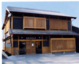
3 鵜飼観覧船待合所